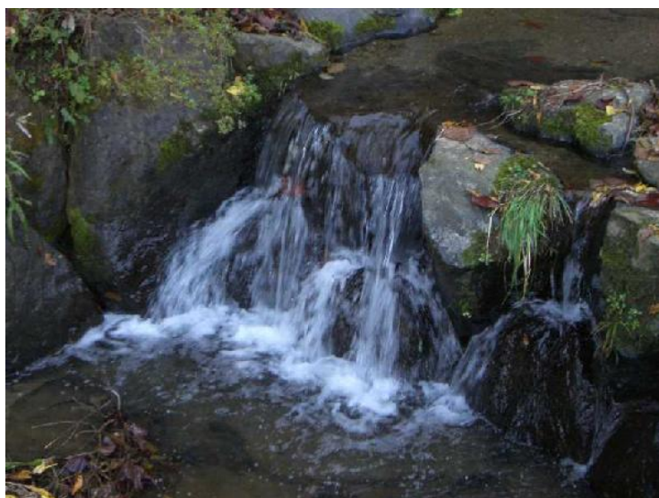
58 共に生きて来た年とった夫婦は 同じ方向に向かって流れ進む