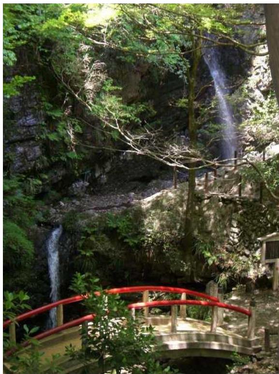
57 橋も起きたできごと