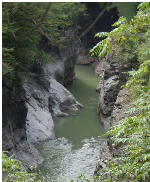
56 ゆったりとした毎日がこの先に現れる かもしれない急流より続くかもしれない