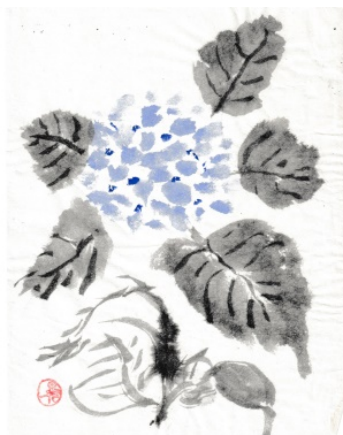
水墨画 東井晃一 (富山県射水郡インストラクター)