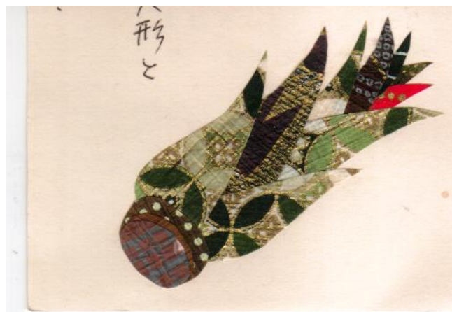
和紙ちぎり絵 黒木幹枝作 (宮城県延岡市インストラクター)